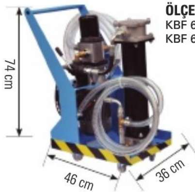
ÖLÇEKLENDİRME KBF 61G-25-HE *T1 KBF 61G-10-HE *T1