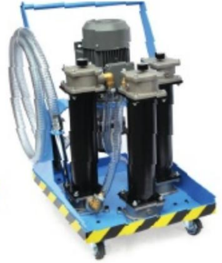
KBF 61G-25-HE *T1 KBF 61G-10-HE *T1