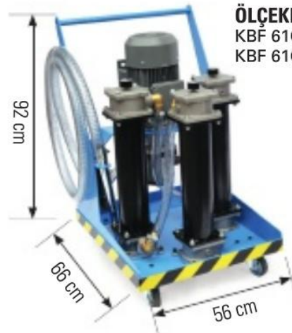
ÖLÇEKLENDİRME KBF 61G2 25/10-HE *T2 KBF 61G3 25/10/5-HE *T2